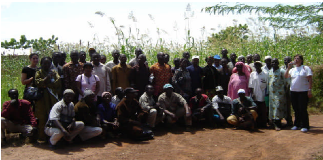
Photo des participants avec les paysans à Ouélessébougou

Cette visite a permis aux participants de voir un exemple conçu de stratégie d'adaptation aux effets des changements climatiques.